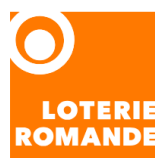
La Loterie Romande