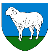
La commune de La Côte-aux-Fées

Ont généreusement soutenu cette publication :