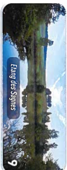
Etang des Sagnes