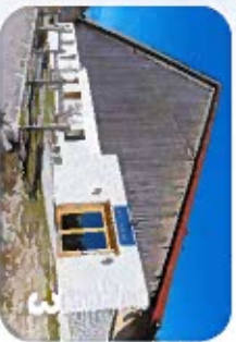
Auberge Entre ces Monts T +33 7 88 17 99 83