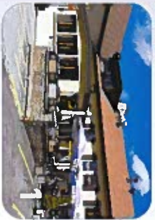
Hôtel Restaurant de la Poste T +41 32 865 10 94