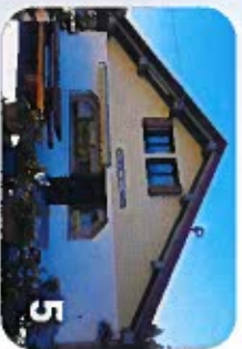
Auberge du Mont-Barres T +41 32 866 14 58