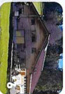
Auberge du Châlet des Prés T +41 32 865 11 75