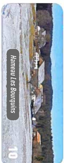
Hameau Les Bourquins