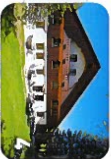
Hôtel Restaurant Le Tillaud T +33 3 81 69 46 72 www.letillaud.com