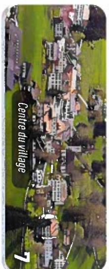
Centre du village