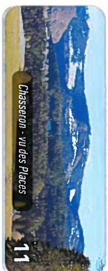
Chasserion - Vu des Places