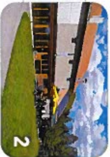
Auberge Au pied de cochon T +41 79 648 13 33 www.aupieddecochon.ch